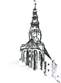
Kościół pw. Św. Stanisława i Św. Wacława Katedra Diecezji Świdnickiej

3/ w sprawie zwolnień od podatku od nieruchomości przedsiębiorców, których płynność finansowa uległa pogorszeniu w związku z ponoszeniem negatywnych konsekwencji ekonomicznych z powodu COVID-19.